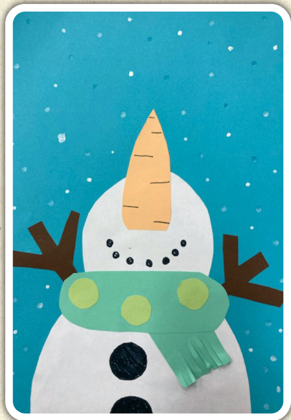
Ajda Jeraj, 4. b