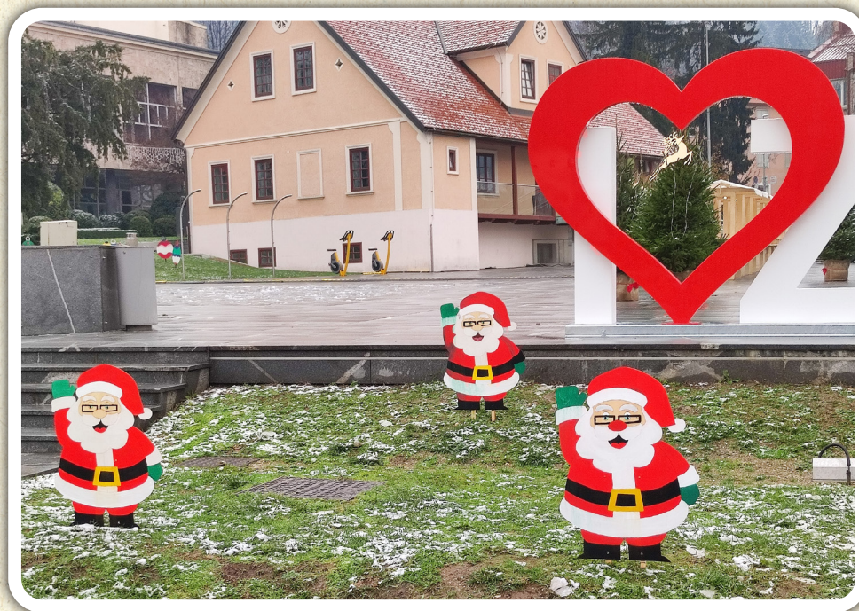
Učenci izbirnega predmeta Likovno snovanje