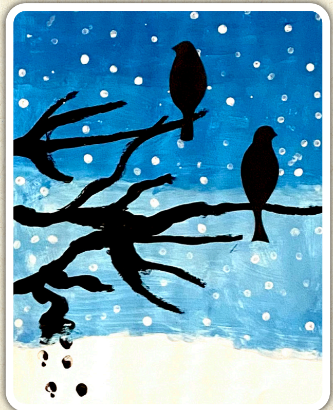
Anže Primc, 1. c