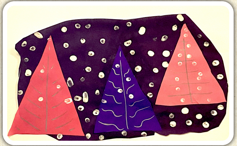
Ambrož Kastelic, 1. c