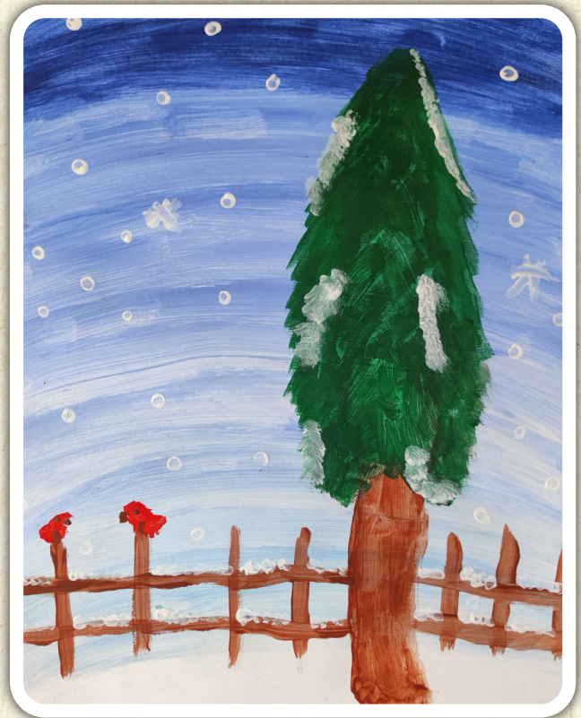
Alina Trumić, 4. c