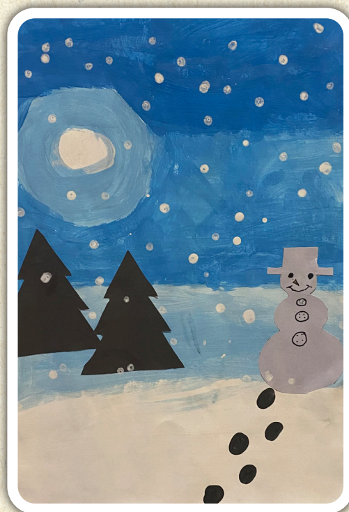
Leila Džombić, 1. c