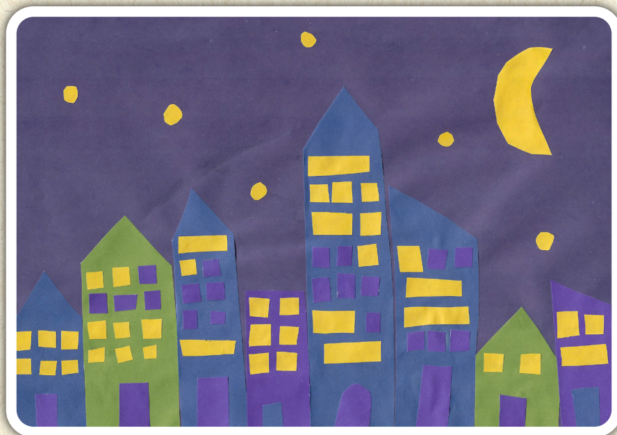
Aurora Primrose Wibowo, 2. b