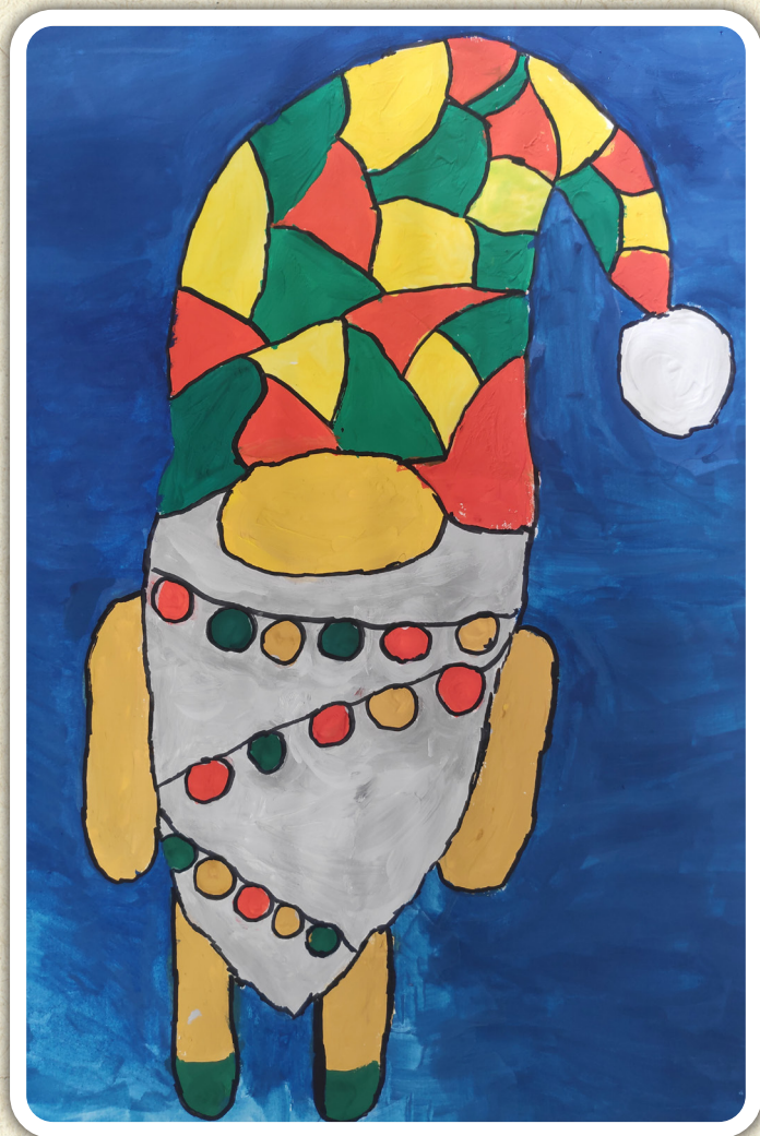
Maja Lebeničnik, 5. a

Medtem je Lucija vzela sanke in uživala na snegu. Zabava je trajala dolgo, za konec pa je