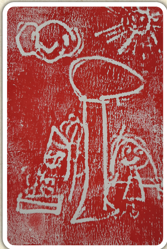
Neli Pobjlšaj, 1. e