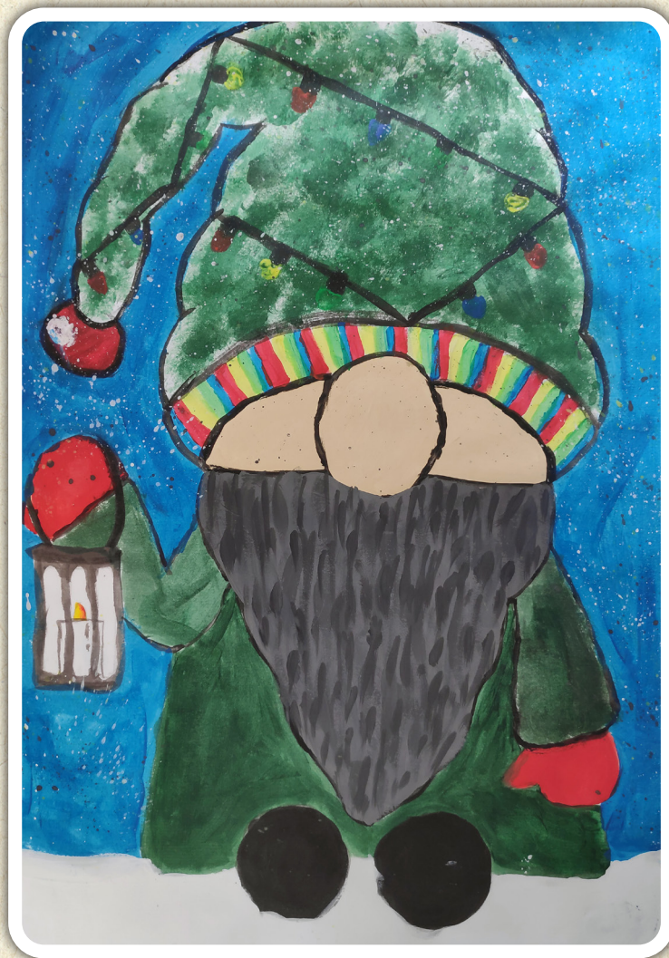
Ula Rozman, 5. a