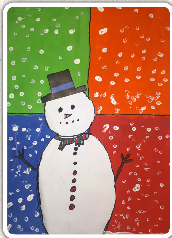
Gal Koporec, 2. a