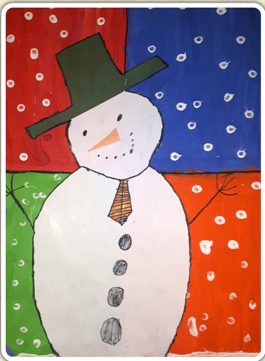
Tilen Ojsteršek, 2. a