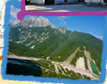
Ponce in skakalnice.