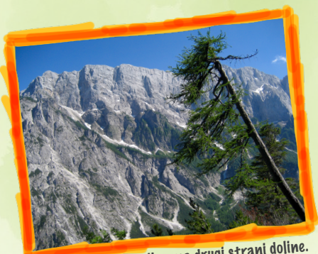
Mojstrovke, Travnik ... na drugi strani doline.