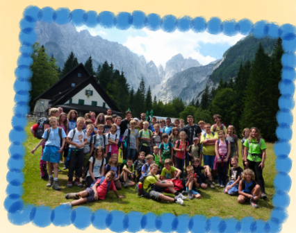
Planinski dom v Tamarju.

Ostale podrobnosti - kaj potrebuješ, česa ne, ... - boš dobil pravočasno, spet pri planinskem mentorju. Če pa te v zvezi s taborom karkoli zanima, pa ga le pocukaj za rokav že prej!