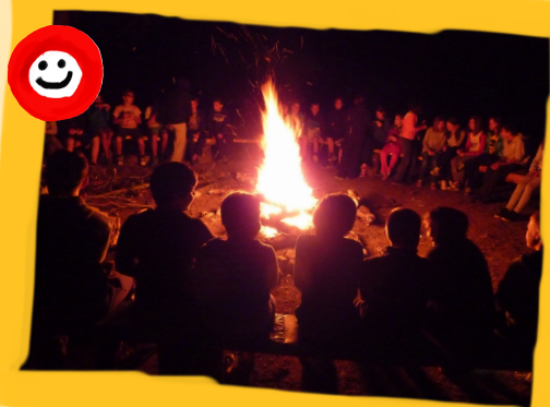
Večer ob tabornem ognju...